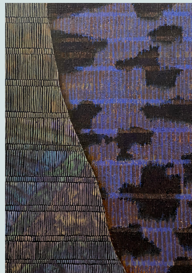
The night is for unfinished business.