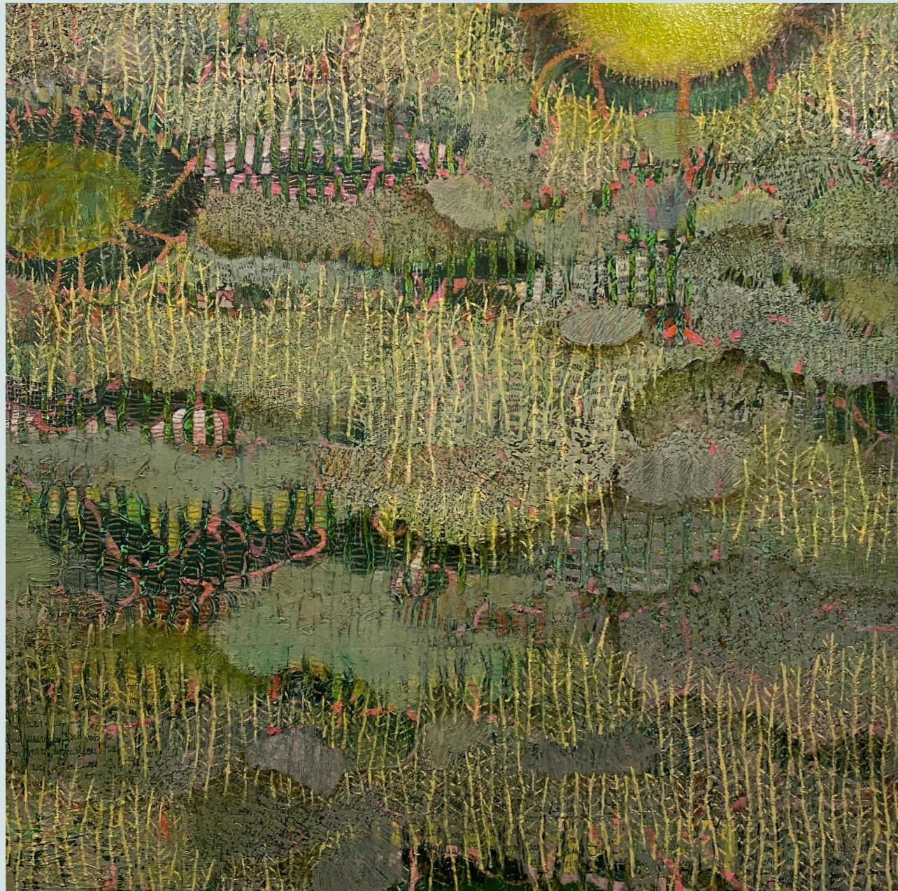
Nature weaves and unweaves.